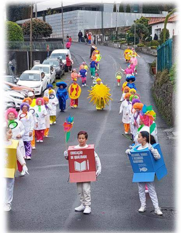
Participação nas Marchas São João,