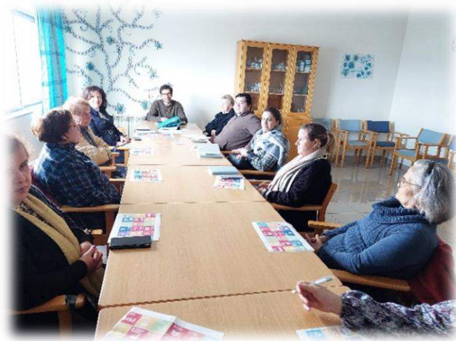
Conselho Eco escolas